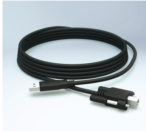
Güvenli USB Kablo